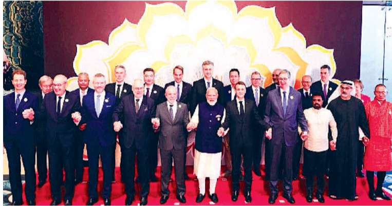
मिलकर आगे बढ़ने से होगा लाभ

पीएम ने कहा कि हमारा मानव विज्ञान 21वीं सदी की एआई संचालित दुनिया में जन कल्याण के लिए एक महत्वपूर्ण कड़ी बनेगा। इसलिए हमें इसका लोकतंत्रीकरण करना होगा। अपने संबोधन में वह ग्लोबल साउथ के देशों का विशेष रूप से उल्लेख करना नहीं भूले और कहा कि एआई को इस क्षेत्र के लिए खासकर समावेशन और सशक्तिकरण का एक उपकरण बनना चाहिए। इसके लोकतंत्रीकरण को समझाते हुए उन्होंने कहा, एआई के लिए इसका केवल डेटा प्वाइंट, कच्चे माल तक सीमित न रह जाए। इसलिए इसका लोकतंत्रीकरण करना होगा। पीएम ने सूरज की रोशनी का जिक्र करते हुए दुनिया के कुछ देशों की एआई को गोपनीय ढंग से विकसित करने की सोच पर टिप्पणी करते हुए कहा कि वो इसे एक सामरिक संपत्ति मानते हैं। इसलिए ऐसा कहते हैं। लेकिन भारत की सोच शेष पेज 7 पर